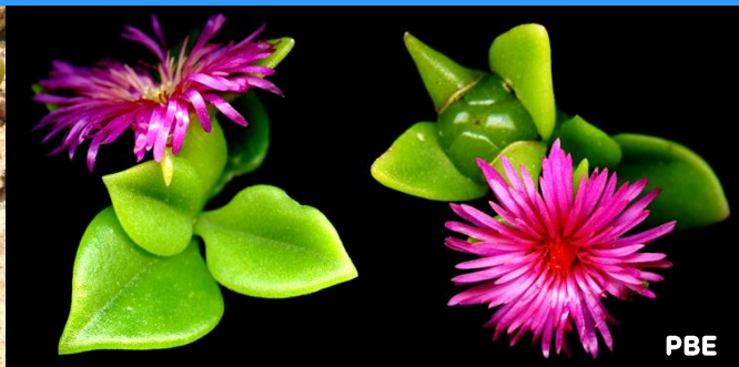
Mesembrythemum cordifolium ("cabellera de la reina") fulles més grans i amples, de forma ovada