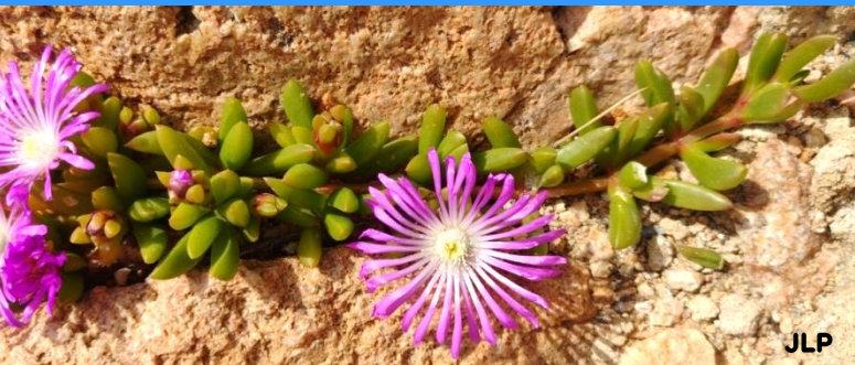
Disphyma crassifolium ("flor del migdia") fulles més grans en forma de llança, de secció triangular